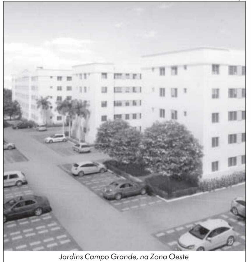
Jardins Campo Grande, na Zona Oeste