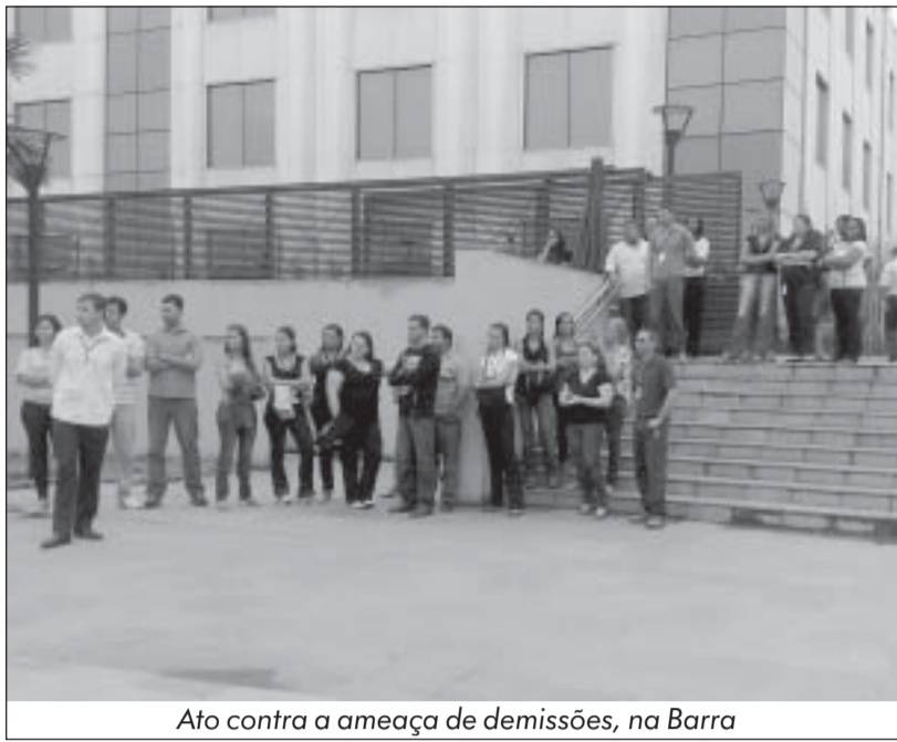
Ato contra a ameaça de demissões, na Barra

O Sindicato também cobra uma reunião em caráter de urgência com a Atento para discutir o pagamento da PLR/2009, pois a empresa já informou que