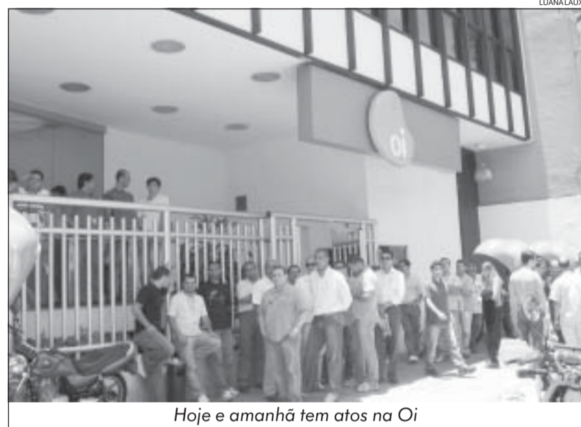
Hoje e amanhã tem atos na Oi

Aumentar o valor do abono indenizatório pela extinção da cesta básica para R$ 2.280 parcelado em duas vezes: R$ 1.710 até 5 dias após a assinatura do Acordo e R$ 570 em novembro de 2010 (todos os valores creditados no cartão alimentação); aceitar o reajuste do auxílio-creche para R$ 282,00; 30% do salário