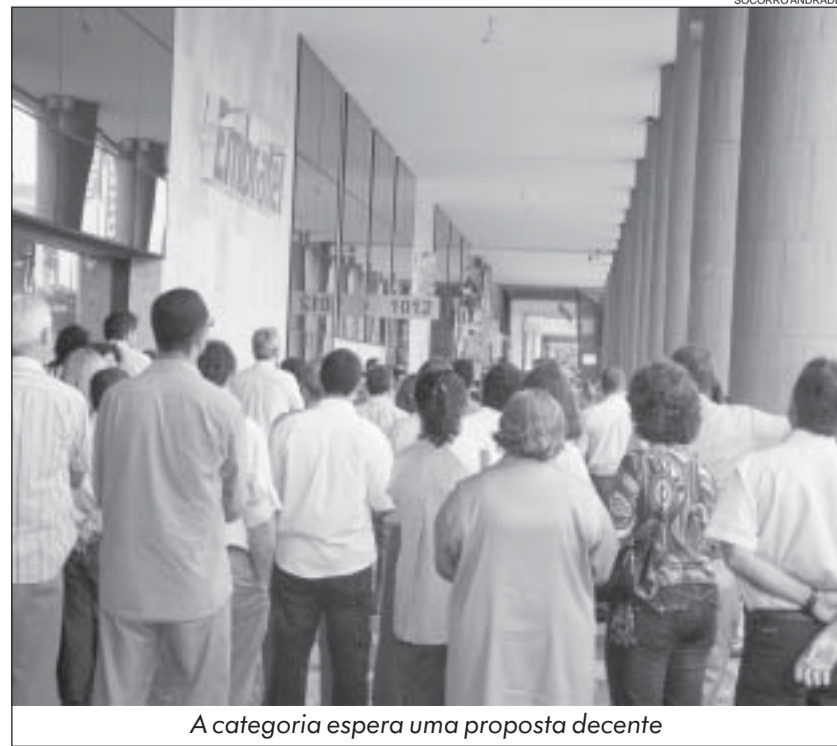
A categoria espera uma proposta decente

Tiquete refeição – R$ 16,30 Tiquete alimentação – R$ 148,00 Auxílio Pré-escolar – R$ 298,65 Educação Especial – R$ 485,00 Antecipação da primeira parcela do 13º em 08 de janeiro.