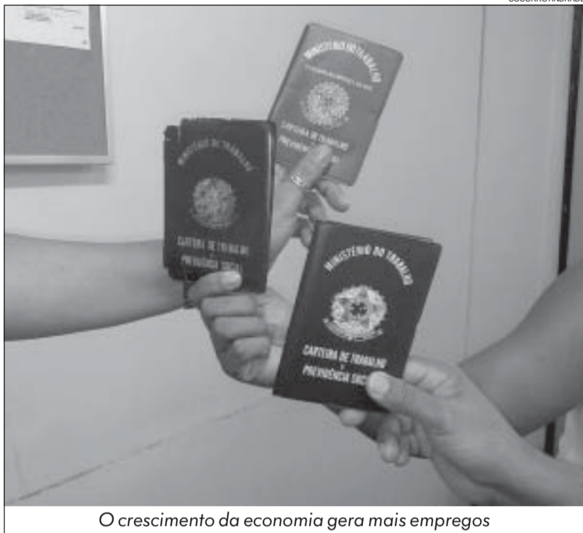
O crescimento da economia gera mais empregos

Ultrapassando todas as estimativas mais otimistas, a economia brasileira explodiu este ano e cresceu 9% no primeiro trimestre em comparação a igual período de 2009. É a maior alta da série histórica nesse tipo de comparação desde 1996. Os dados foram divulgados no dia 8 pelo Instituto Brasileiro de Geografia e Estatística (IBGE). Isso significa mais emprego e mais renda, motivos de sobra para comemorarmos.