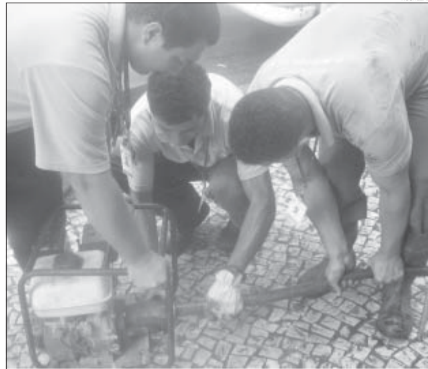
Pagamento tem que ser feito com 60 horas acumuladas

Para confundir mais ainda, alguns supervisores estão passando para os trabalhadores que o pagamento das horas extras acumuladas no Banco é feito a partir de 60 horas. Isso não é verdade. Conforme o Parágrafo 4º, estas deverão ser pagas totalmente ao atingir as 60 horas, em qualquer período. Se as extras não atingirem as 60 horas, o número de horas feitas só será paga no