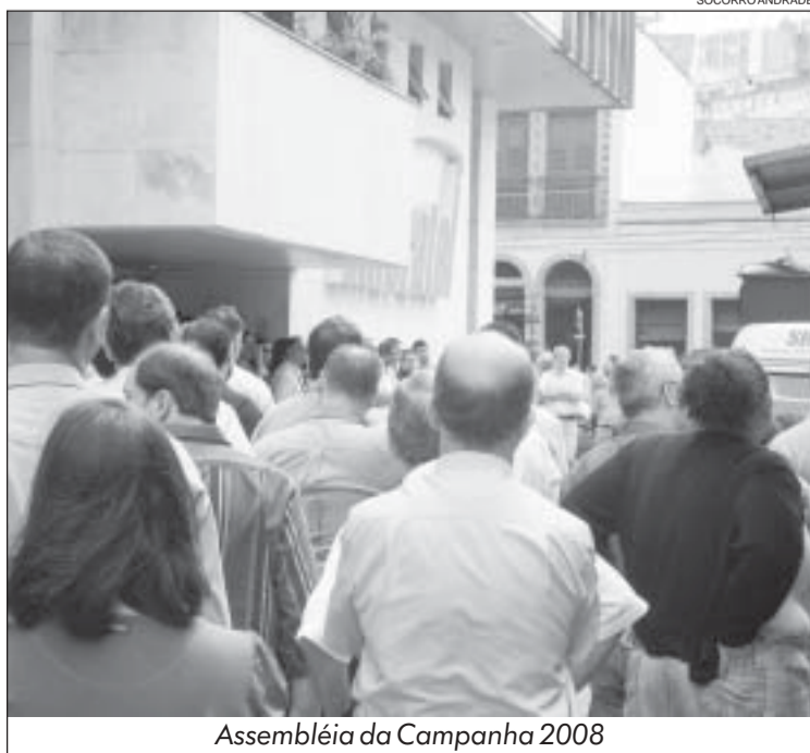
Assembleia da Campanha 2008

- PPR - embora não faça parte do Acordo, a empresa propôs a antecipação do pagamento da PPR 2009 para o dia 26 de fevereiro de 2010, para todos os empregados que tiverem sua avaliação de desempenho concluída até 11.02.10.